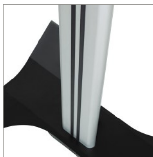
Nowoczesny wygląd dzięki połączeniu dwóch kolorów