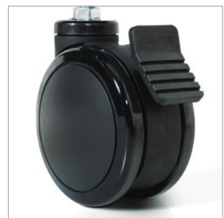
W zestawie z kółkami - nie pozostawiają śladów (funkcja blokady i hamowania)