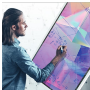
Pochylenie ujemne -4,5° zapewnia ergonomiczną, naturalną powierzchnię do pisania